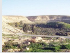
الشلالة.. «كنز مدفون» على ارض الرمثا وتمتاز بعيون المياه وبساتين الأشجار المثمرة