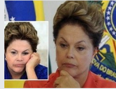
نواب البرازيل يعزلون رئيسها.. واللبناني تامر رئيساً