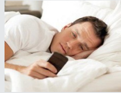
6 أشياء لا تفعلها قبل النوم أبداً