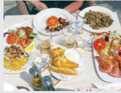
أفكار خاطئة عن بعض الأغذية