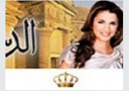
مقتل طالبة طعنا داخل جامعة العلوم والتكنولوجيا