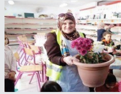
أردنية تطلق مبادرة لتجميل الساحات المحيطة بالمساجد