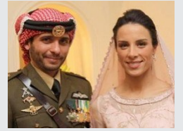
الأميران حمزة وبسمة يرزقان بمولودة أسمياها "بدية"