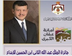
جائزة الملك عبد الله الثاني ابن الحسين للإبداع وفاة الطالبة التي طعنها أحد اقاربها في جامعة العلوم والتكنولوجيا فجر اليوم